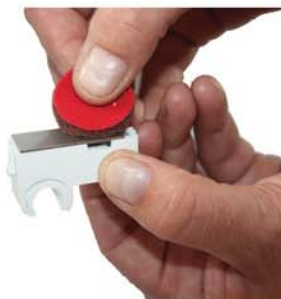
Förbehandla limytan genom att rugga av oxidskikt.