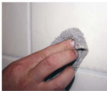
Torka torrt med ren trasa