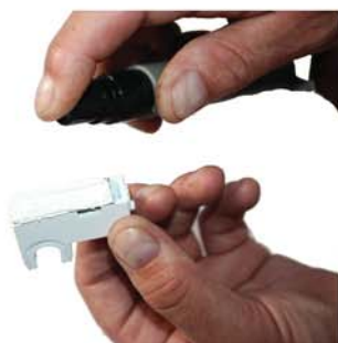
Spraya på limmet