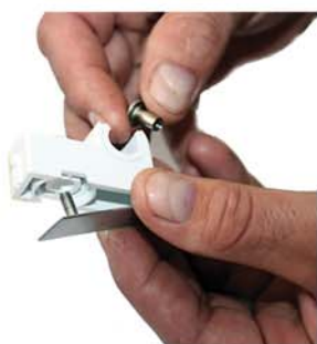
Montera fast limplattan på rörklamman

Nu kan du enkelt montera rörklammer utan att borra. Brickorna passar till både FALU och PURUS, enkel resp. dubbel rörklamma. Nedan ett exempel på montage av rörklamma med Glabete montagebrickor och Glabete Aerosol.