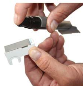
Spraya och torka torrt.