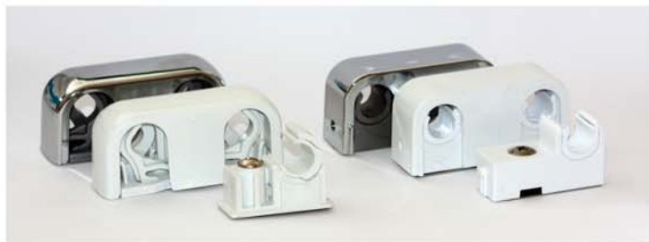
Limplatta för rörklammer (dubbel)