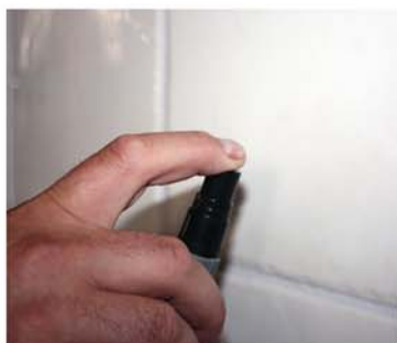
Spraya och rengör ytskikt