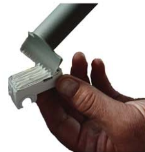
Rilla lim med tandspackel.